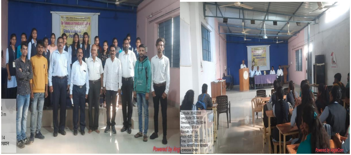
Organizing Committee and Board of Studies in Political Science, Department of Political Science, Shri Saibaba Lok Prabodhan Arts College, Wadner. District – Wardha.