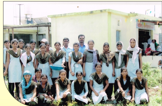
ग्रामीण रुग्णालय वडनेर येथील परिसरात स्वच्छ भारत अभियानामध्ये सहभागी रा.से.यो. स्वयंसेवक व महाविद्यालयीन विद्यार्थीनी