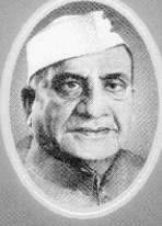
Dr. Panjabrao alias Bhausaheb Deshmukh Founder President