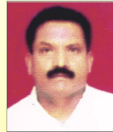
प्रदिप महल्ले सदस्य स्थानिक व्यवस्थापन समिती