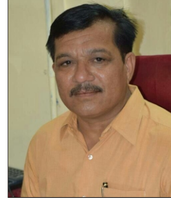
मा.प्रा.डॉ.आर.बी.भांडवलकर अमोलकचंद महाविद्यालय, यवतमाळ