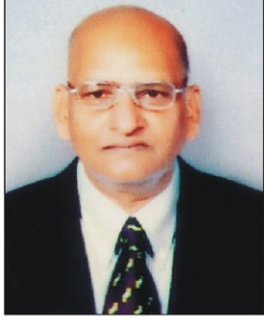
मा.प्रा.डॉ. उत्तमराव पारेकर यशवंत महाविद्यालय, वर्धा