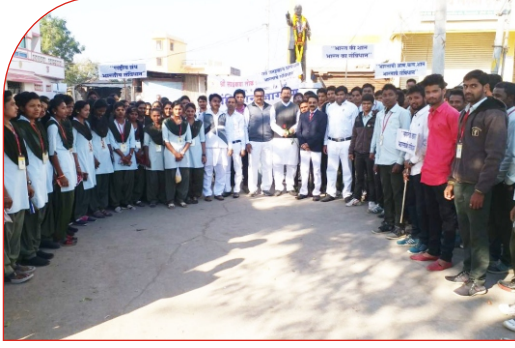
२६ जानेवारी २०१८ ला प्रजासत्ताक दिनानिमित्त काढलेल्या रॅलीचा समारोप डॉ. बाबासाहेब आंबेडकर चौक वडनेर येथे करण्यात आला. याप्रसंगी उपस्थित महाविद्यालयातील प्राध्यापक वर्ग व विद्यार्थी